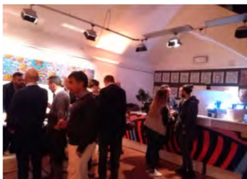
Sala piano inferiore